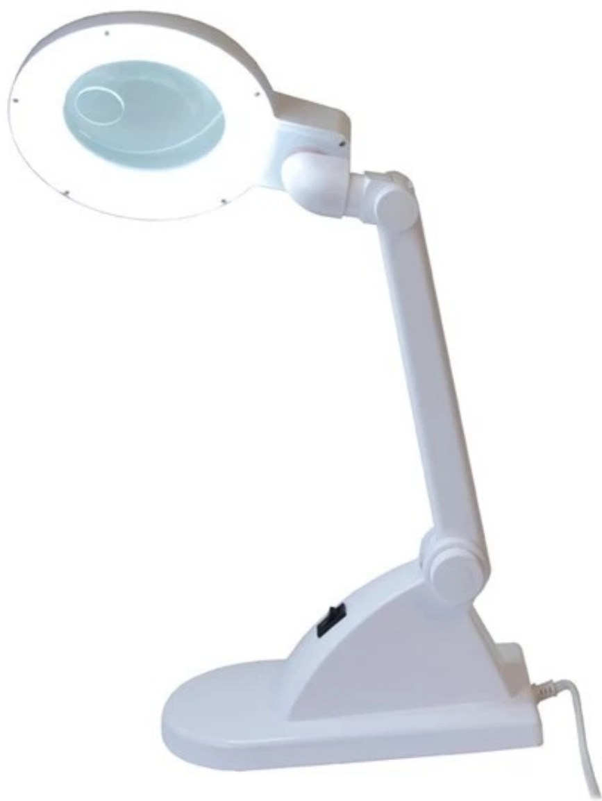
Zdjęcie poglądowe wersji białej